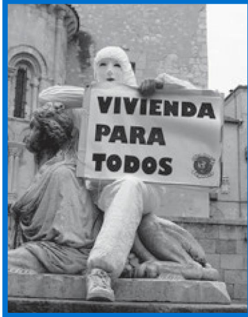
Todas las personas tienen derecho a una vivienda (art. 25 Derechos Humanos).