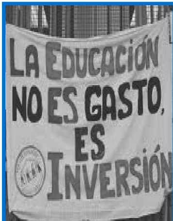
Todas las personas tienen derecho a la educación (art. 26 Derechos Humanos).